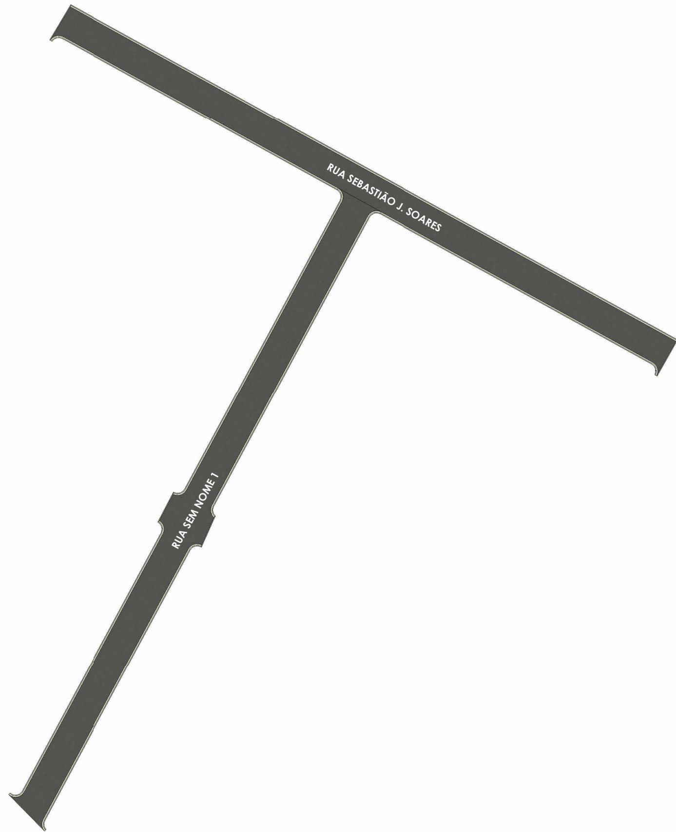
PLANTA HUMANIZADA - RUA SEBASTIÃO JARBAS SOARES E SEM NOME 1 ESC:1 : 750